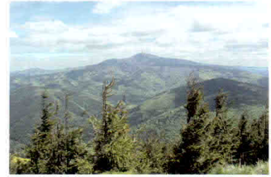
Obr. 6. Nejvyšší hora Moravskoslezských Beskyd – Lysá hora (1323 m n. m.).

získávají informace nejen o pohybu vzácných šelem, ale také důležité informace o velikosti populace, struktuře pohlaví