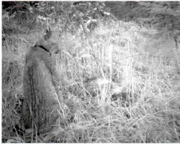
Obr. 4. Při GPS telemetrii vysílá obojek pravidelné zprávy o pohybu zvířete.

je periodicky měněno. Každá fotopast je opatřena GPS souřadnicemi, které jsou převáděny do prostředí GIS. Existují tak