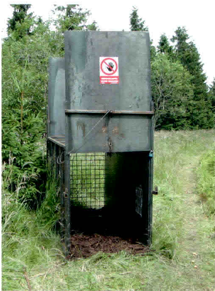
Obr. 3. Odchytná klec na medvěda – každé zařízení má své souřadnice přenášené do mapových podkladů.

Jak již bylo uvedeno, projekt na likvidaci invazní křídlatky představoval první impuls pro práci s GIS v ČSOP Salamandru.