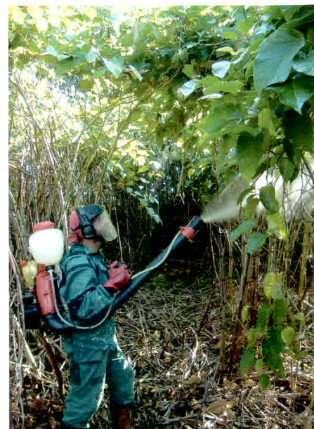
Obr. 2. Likvidace invazní křídlatky pomocí postřiků.

GIS byl zpočátku využíván výhradně k digitalizaci nálezů z terénního mapování, např. výskytu zvláště chráněných druhů rostlin a živočichů v určité oblasti. Dnes se však i botanické a zoologické průzkumy provádějí s pomocí zařízení GPS a následně se terénní data jednoduše převedou do prostředí GIS, kde s nimi lze dále pracovat. Obecně lze konstatovat, že kombinace