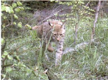
Obr. 5. Dosavadní výsledky ukazují, že rysů v Beskydách je méně než deset.

vrstvy s aktuálními i minulými pozicemi fotopastí, které obsahují další potřebné charakteristiky (datum instalace, termíny kontrol atd.)