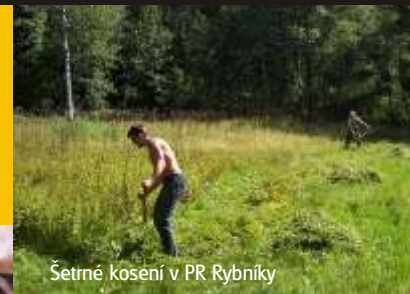
Šetrné kosení v PR Rybníky