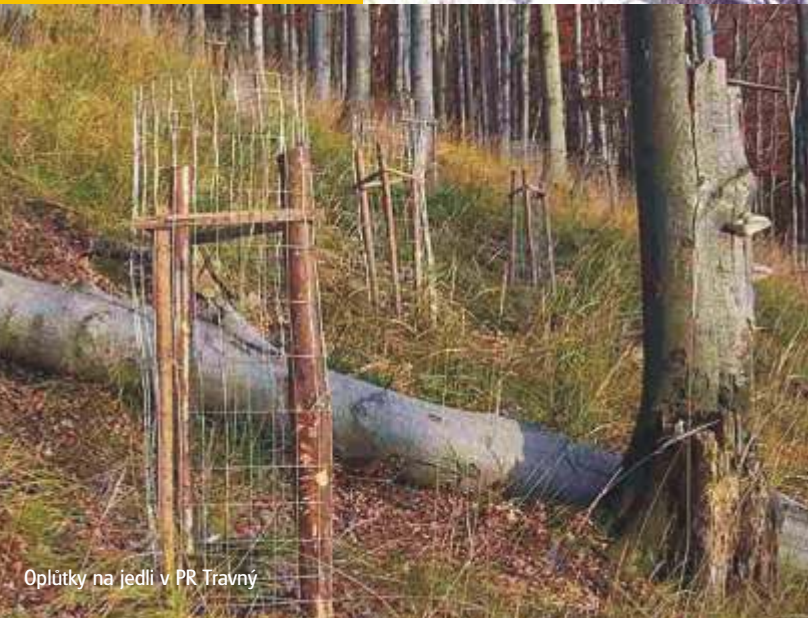
Oplůtky na jedli v PR Travný