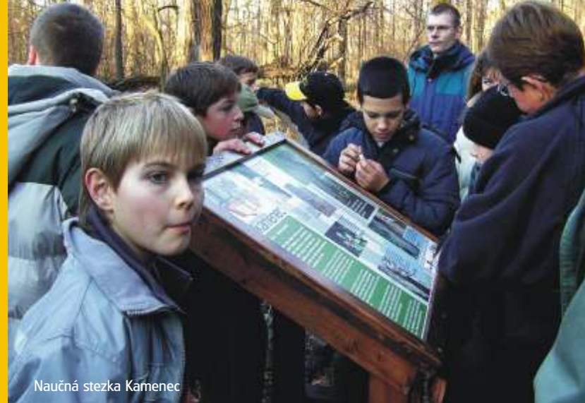
Naučná stezka Kamenec