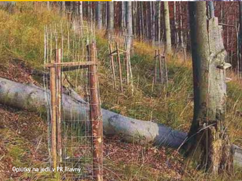
Oplůtky na jedli v PR Travný