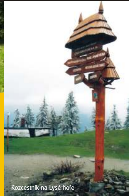
Rozcestník na Lysé hoře