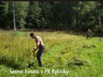
Šetrné kosení v PR Rybníky