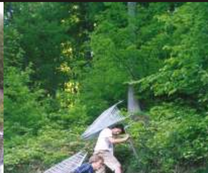
Umísťování kovových klecí

– výsek kleče v PR Smrk – sběr a výsev semen jeřábu – ve vrcholových partiích Lysé hory úklid těžebního odpadu, zalesňování