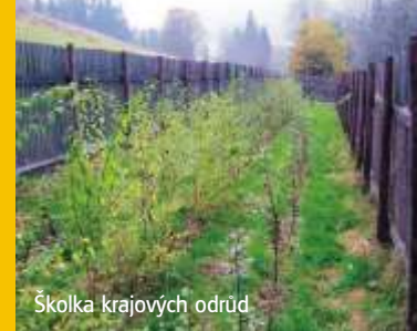
Školka krajových odrůd