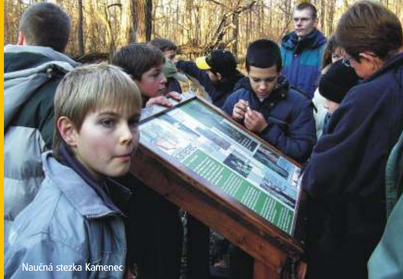
Naučná stezka Kamenec