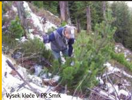
Výsek kleče v PR Smrk

Cílem programu je péče o cenné lokality (maloplošná chráněná území, I. a II. zóny CHKO) na území Chráněné krajinné oblasti Beskydy a Moravskoslezského kraje.