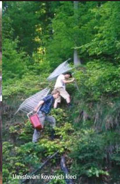
Umísťování kovových klecí

– výsek kleče v PR Smrk – sběr a výsev semen jeřábu – ve vrcholových partiích Lysé hory úklid těžebního odpadu, zalesňování