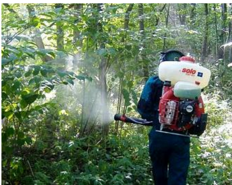
Křídlatka ohrožuje svou rozpínavostí původní společenstva rostlin nejen v Poodří, ale i v celé republice. Tříletý projekt, který zajistí její likvidaci, by měl pomoci omezit či úplně zastavit její další rozmnožování.