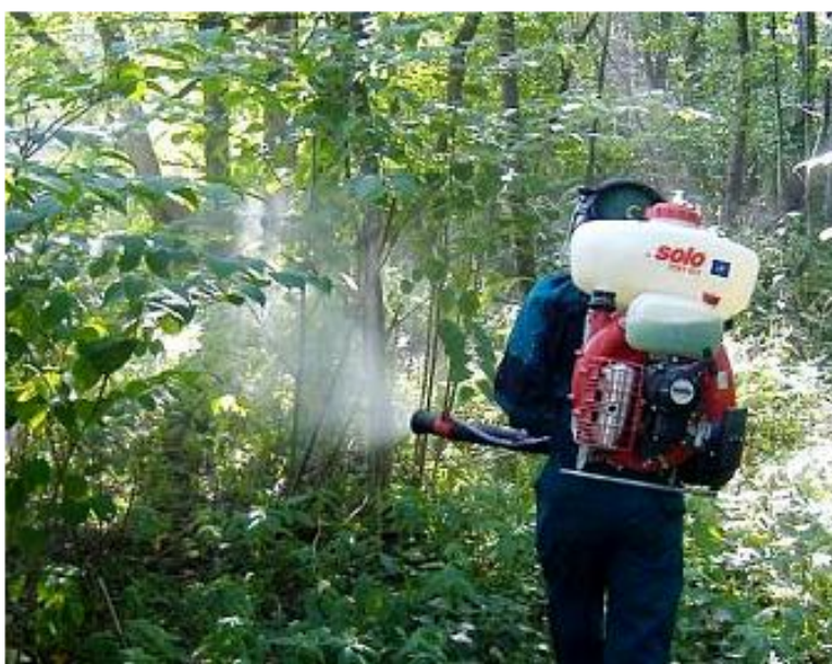
Křídlatka ohrožuje svou rozpínavostí původní společenstva rostlin nejen v Poodří, ale i v celé republice. Tříletý projekt, který zajistí její likvidaci, by měl pomoci omezit či úplně zastavit její další rozmnožování.